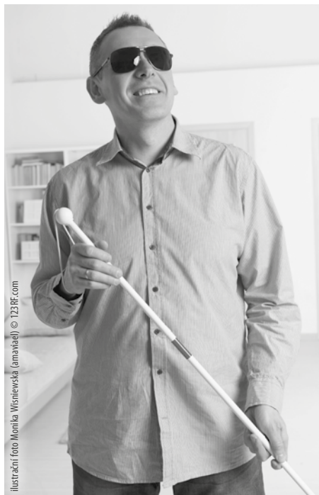
Ilustrační foto Monika Winiarska (amadej) © 123RF.com

A tak se sám sebe ptám: Co je víc? Kristus sám, nebo Kristus, kterého jsem si vymodeloval? Kdo je skutečný a živý Bůh, a kdo je jen jeho karikatura? Je Ježíš, ve kterého věřím, Ježíšem reálným? Je skutečně tím, kterého zjevuje